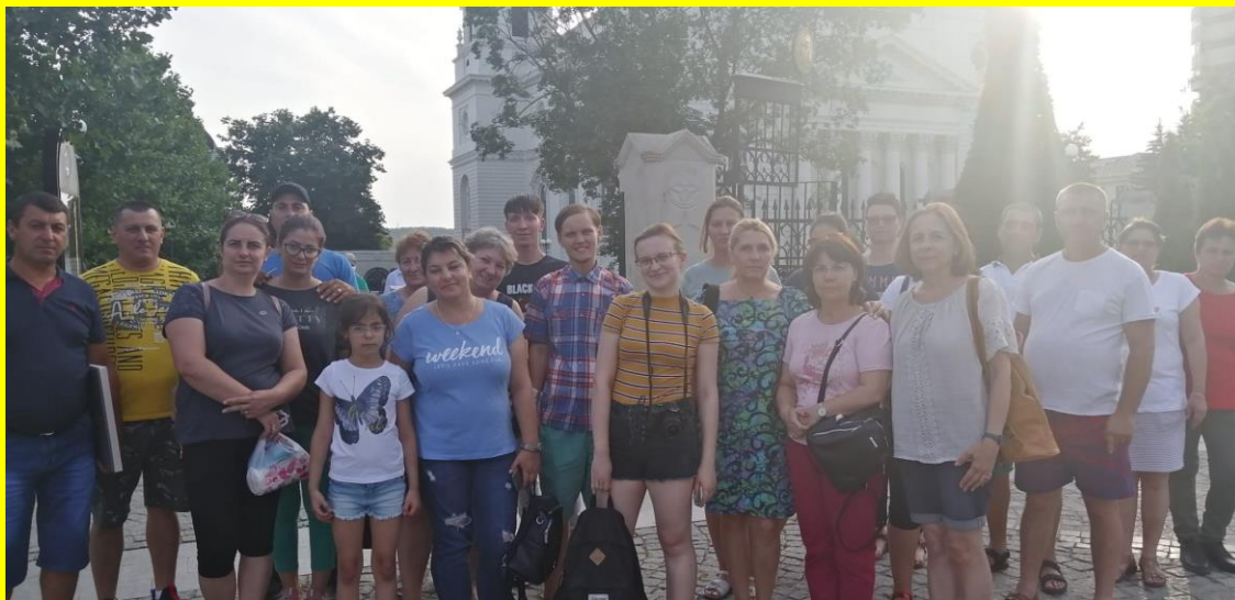
În fața teatrului național