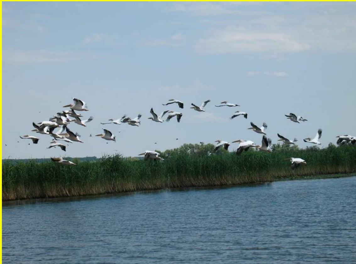
Mentiune I –Vegetație în apă