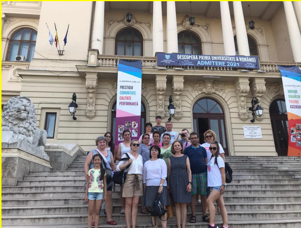
Pe meleaguri ieșene