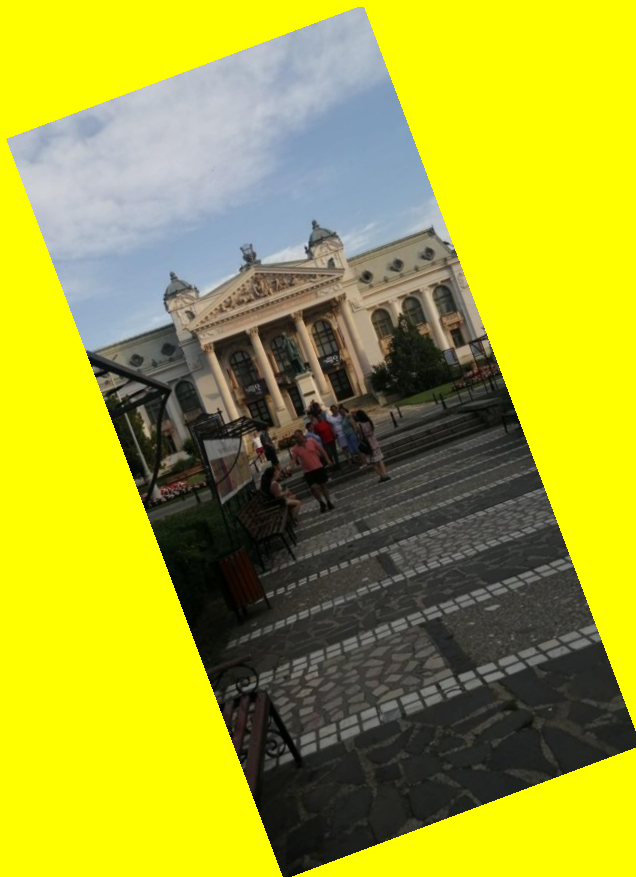
la Palatul Culturii